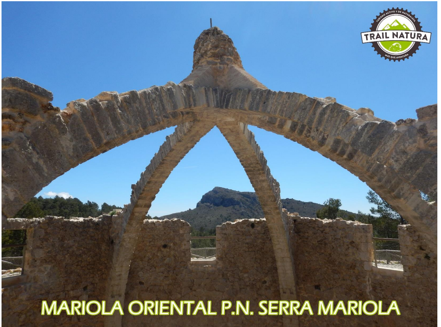
MARIOLA ORIENTAL P.N. SERRA MARIOLA